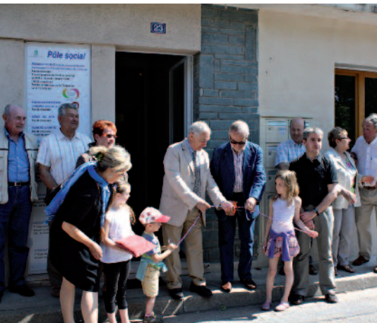
Le Pôle social a été inauguré le 22 mai 2010.

Depuis un an, les associations caritatives forment un Pôle social dans les anciens bâtiments EDF, à l'initiative de la municipalité, qui souhaite conforter ce foyer d'humanité en y créant un Atelier social.