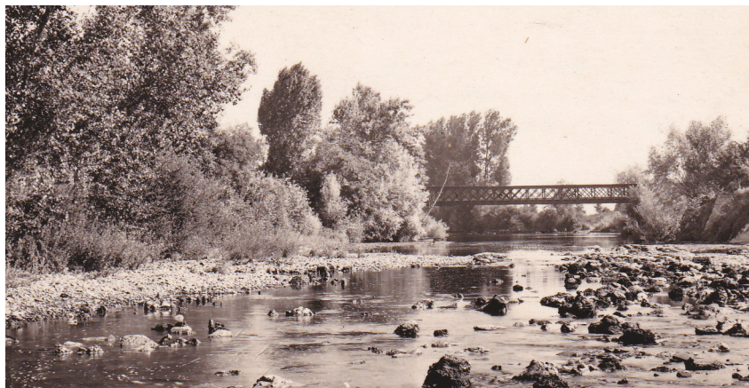
Le pont du tacot dans les années 50

laboration avec le syndicat intercommunal d'alimentation en eau potable de construire une passerelle en béton armé d'1,40m de large. Cette décision est d'ailleurs mentionnée dans une convention établie entre la ville et le syndicat, datant du 17 décembre 1952, « il est convenu