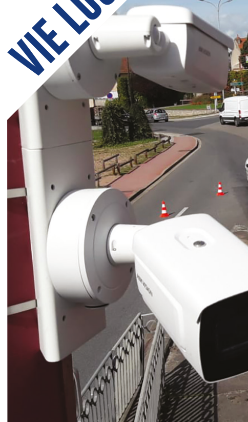
Les nouvelles caméras au carefour de la route de Moulins