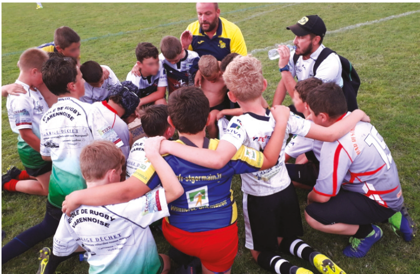
Les enfants du rugby écoutent les consignes du coach